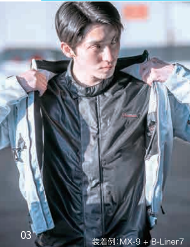
装着例: MX-9 + B-Liner7