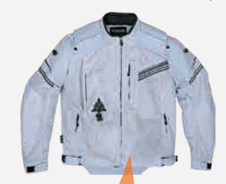
例: MX-9 / ジャケット単体 (エアバッグ無し)