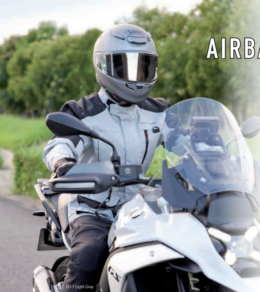
EU-7 Light Gray