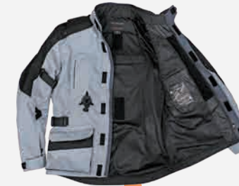
例: EU-7 / エアバッグ装着 (ジャケット+エアバッグ)