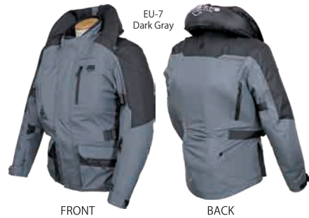
EU-7 Dark Gray