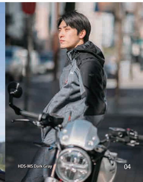
HDS-MS Dark Gray