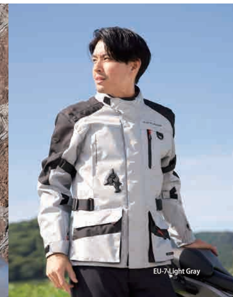
EU-7 Light Gray