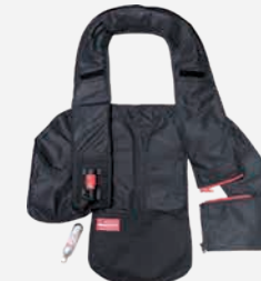
取り外したエアバッグインナー