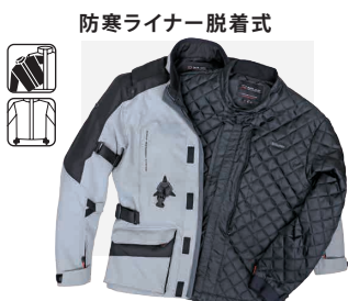
防寒ライナー脱着式