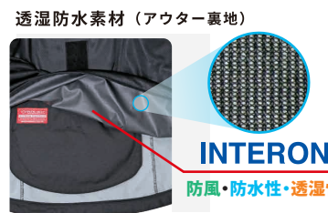
透湿防水素材 (アウター裏地)