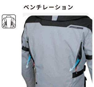
ベンチレーション