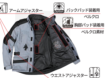
アームアジャスター