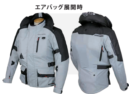
エアバッグ展開時