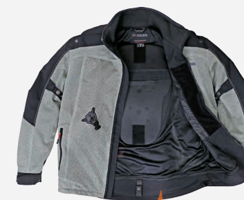
例: HDS-MS/ ジャケット単体 (エアバッグ無し)