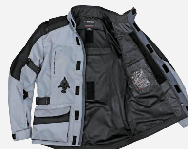
例: EU-7/エアバッグ装着 (ジャケット+エアバッグ)