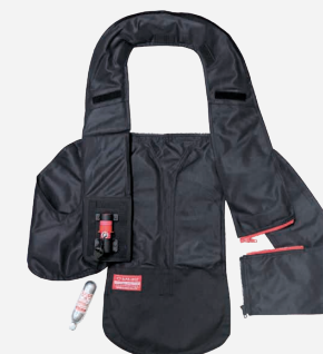
取り外したエアバッグインナー