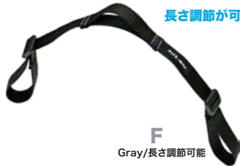
長さ調節が可能なF(フリーサイズ)