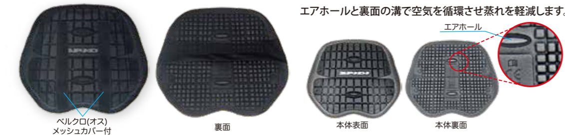
ベルクロ(オス)メッシュカバー付