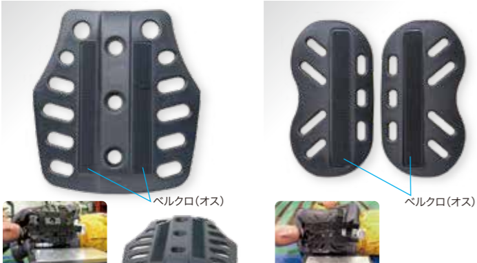
JARI胸部衝撃試験 一体型胸部パッド2