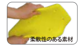
柔軟性のある素材