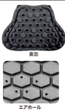
蜂の巣構造が衝撃を分散